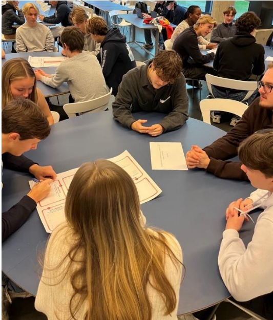
Workshop med elevrådet med tema skolemiljø.