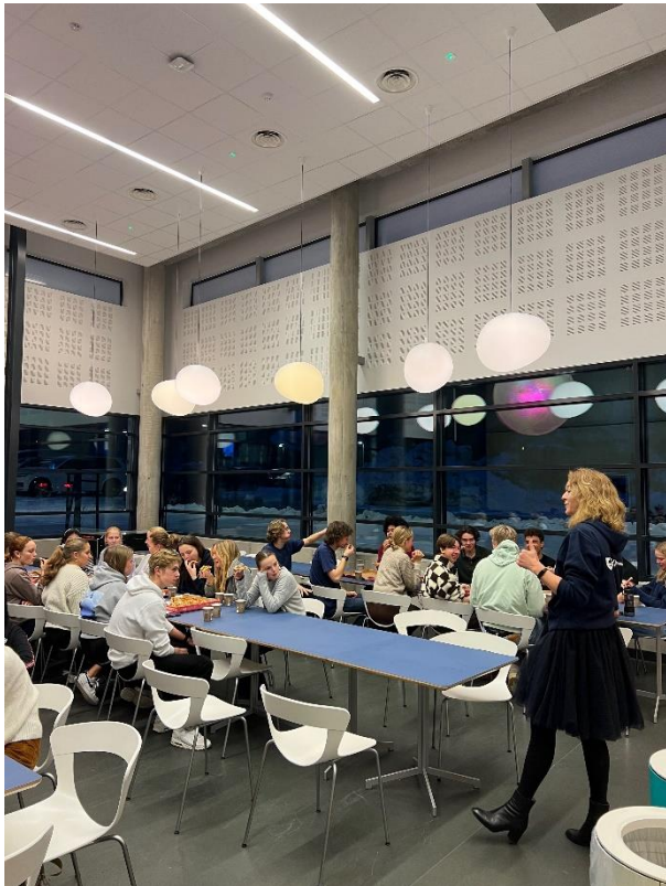
Elever engasjerer seg for skolemiljø.