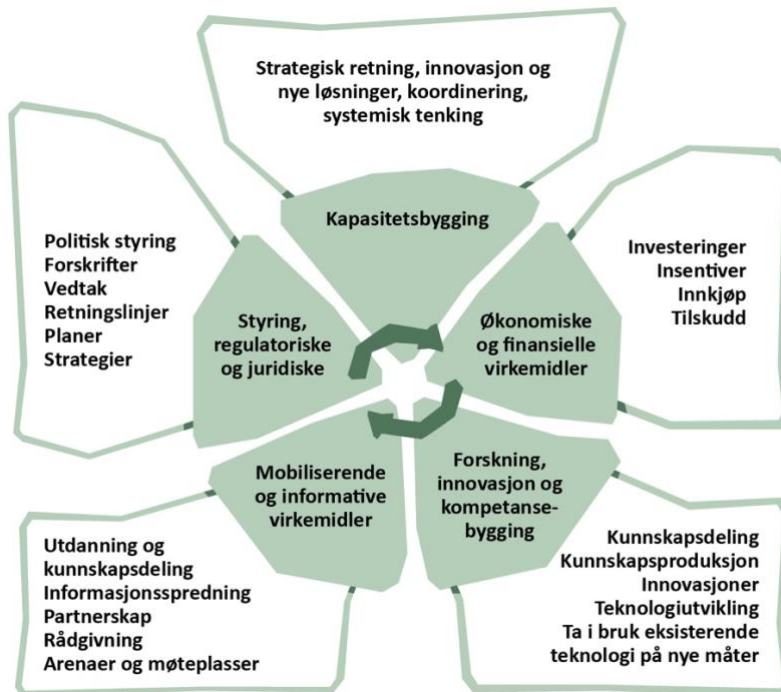
Figur: Illustrasjon og oversikt over de fem virkemiddelkategoriene som er beskrevet i avsnittet over.

avgjørelser, jobbe på tvers av siloer, ta steget bort fra etablerte praksiser som ikke er bærekraftige, og legge til rette for kontinuerlig læring gjennom nettverk og dialog.