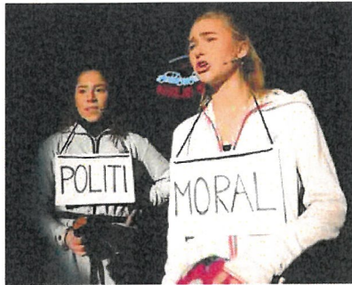
«Du er en sånn som lar vannkranen renne mens du pusser tennene», skriker moralpolitiet mens de går rundt og spruter vann på publikum med en vannpistol.