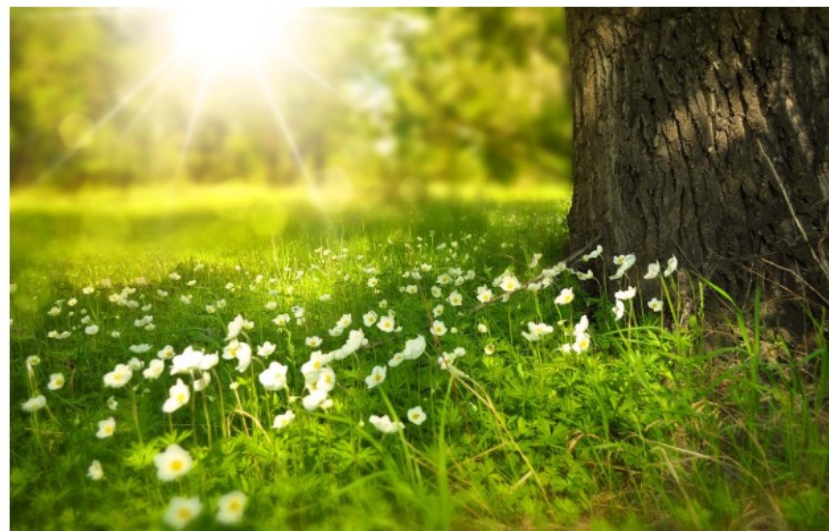
Sol og grønn eng

Dersom du mener at gjeldende regelverk for karaktersetting ikke er fulgt kan du klage på standpunktkarakteren i et fag eller i orden eller i oppførsel.