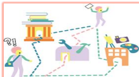
Språk, samfunnsfag og økonomi