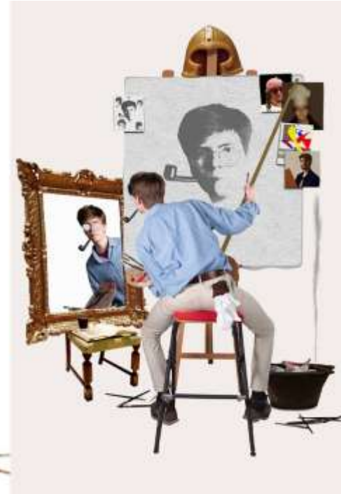
Look-a-Like foto. Elevarbeid 2023