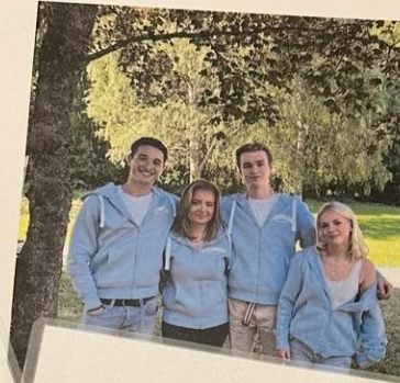
Faddergruppe klasse 1STA