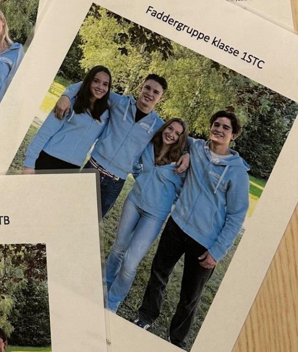
Faddergruppe klasse 1STC