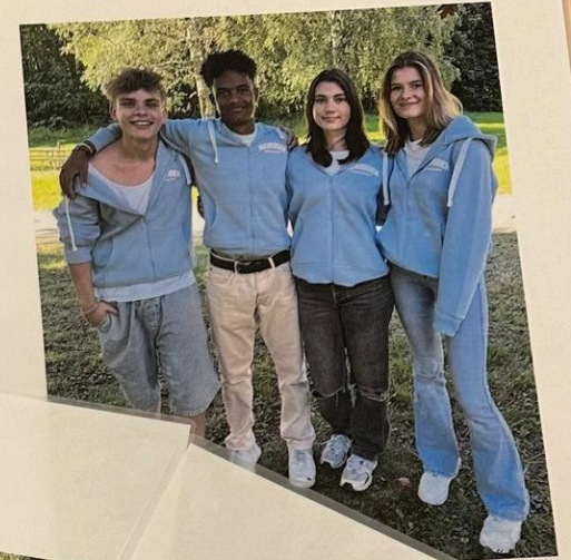
Faddergruppe klasse 1EL