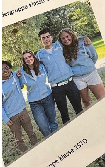
Faddergruppe klasse 1HO