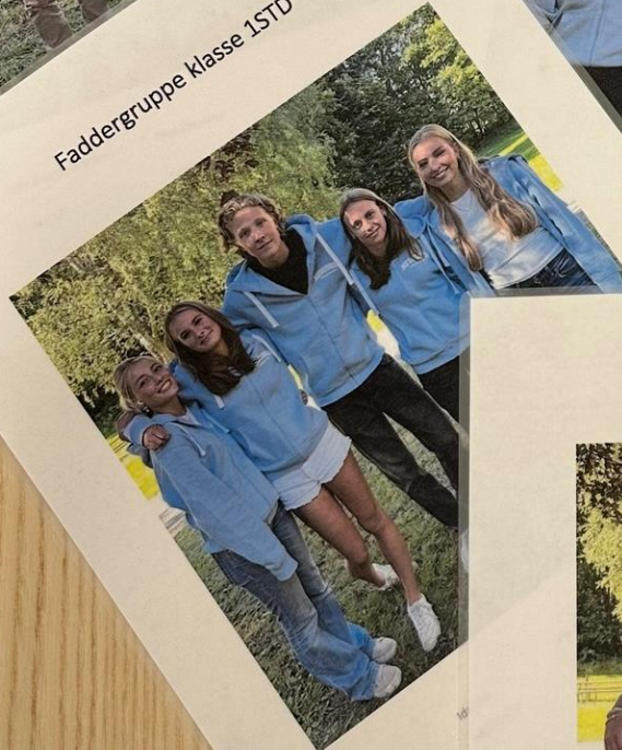
Faddergruppe klasse 1STD