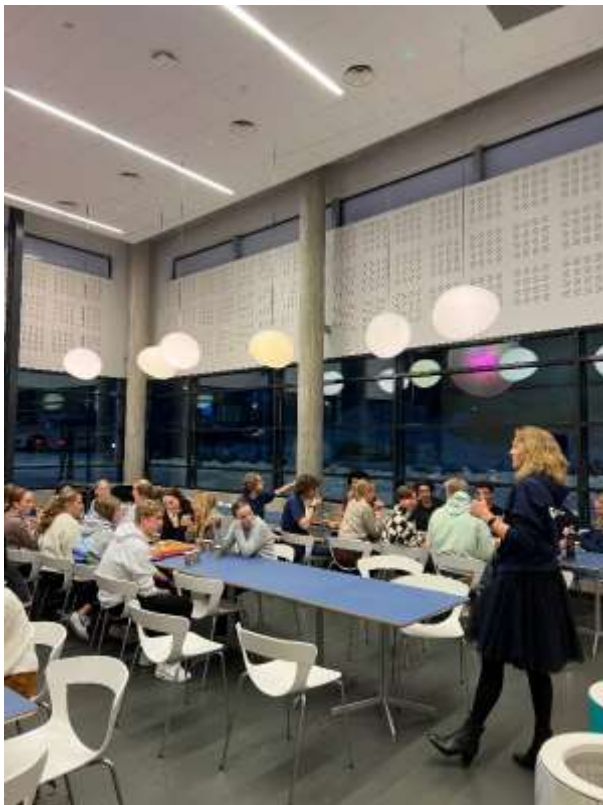
Elever engasjerer seg for skolemiljø.