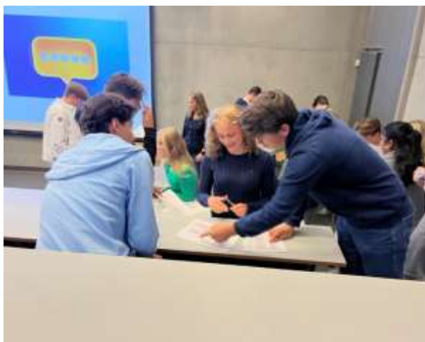
Workshop med elevrådet med tema skolemiljø.